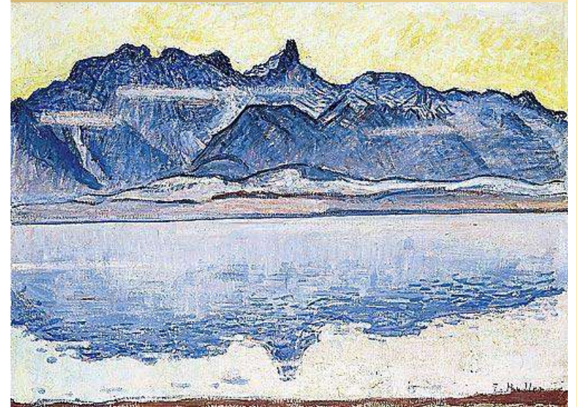
FERDINAND HODLER, Thunersee mit Stockhornkette im Winter, 1912/13